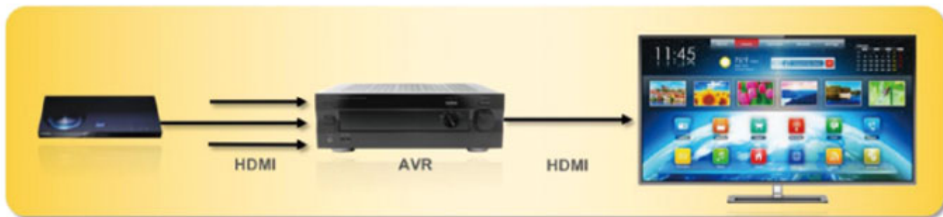
eARC를 사용하지 않을 때의 AVR 연결

이들 데이터 관련 신호들은 eARC 기기에서는 필수 사항이다. 이들 신호는 광 케이블(TOSLINK) 또는 SPDIF 오디오에는 사용되지 않으며, 기존의 HDMI-ARC 오디오에서는 옵션으로 제공된다.